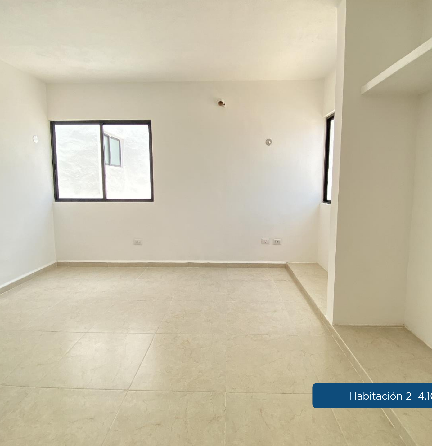
Habitación 2 4.10 m x 3.50 m