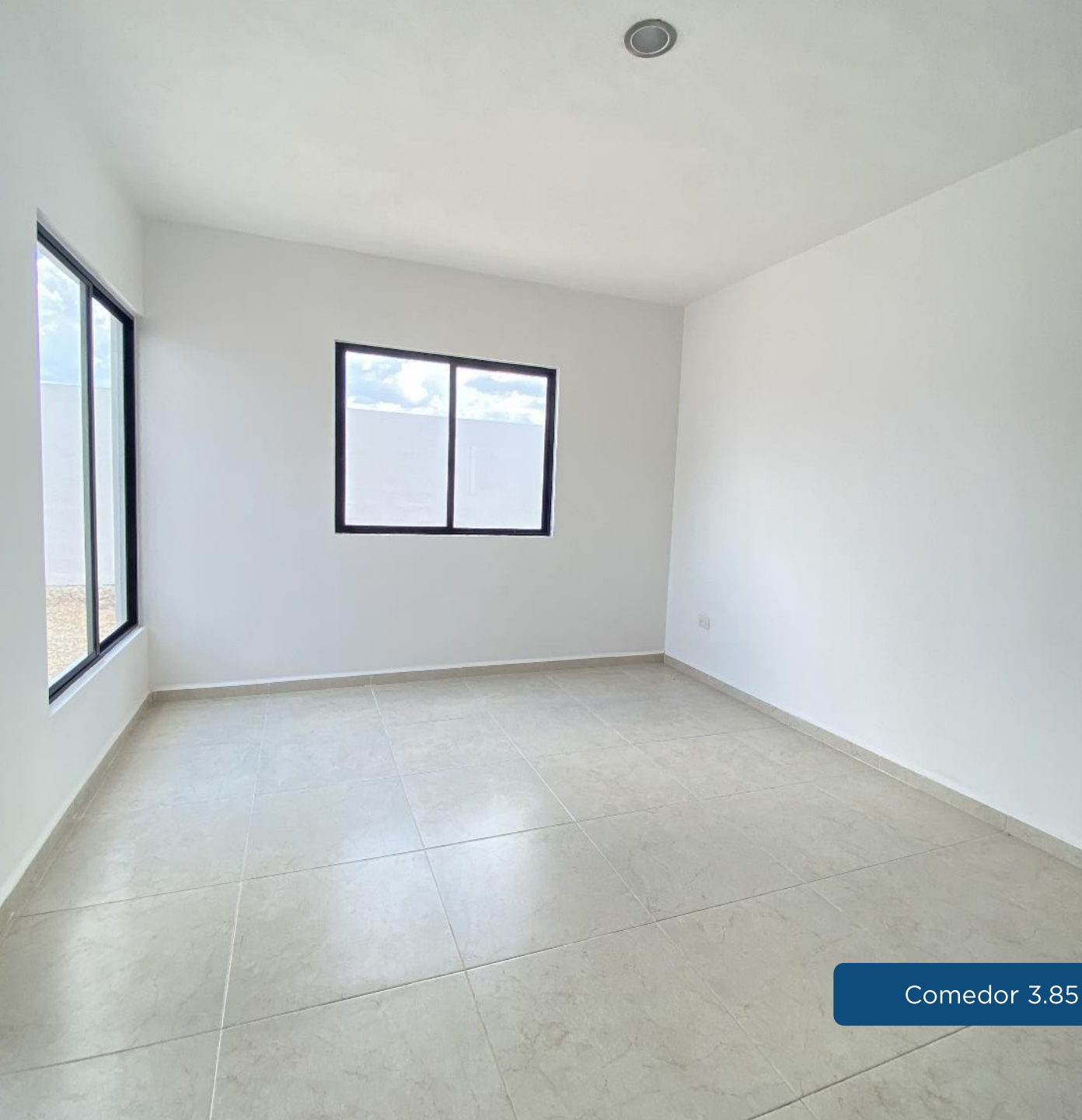
Comedor 3.85 m x 3.50 m