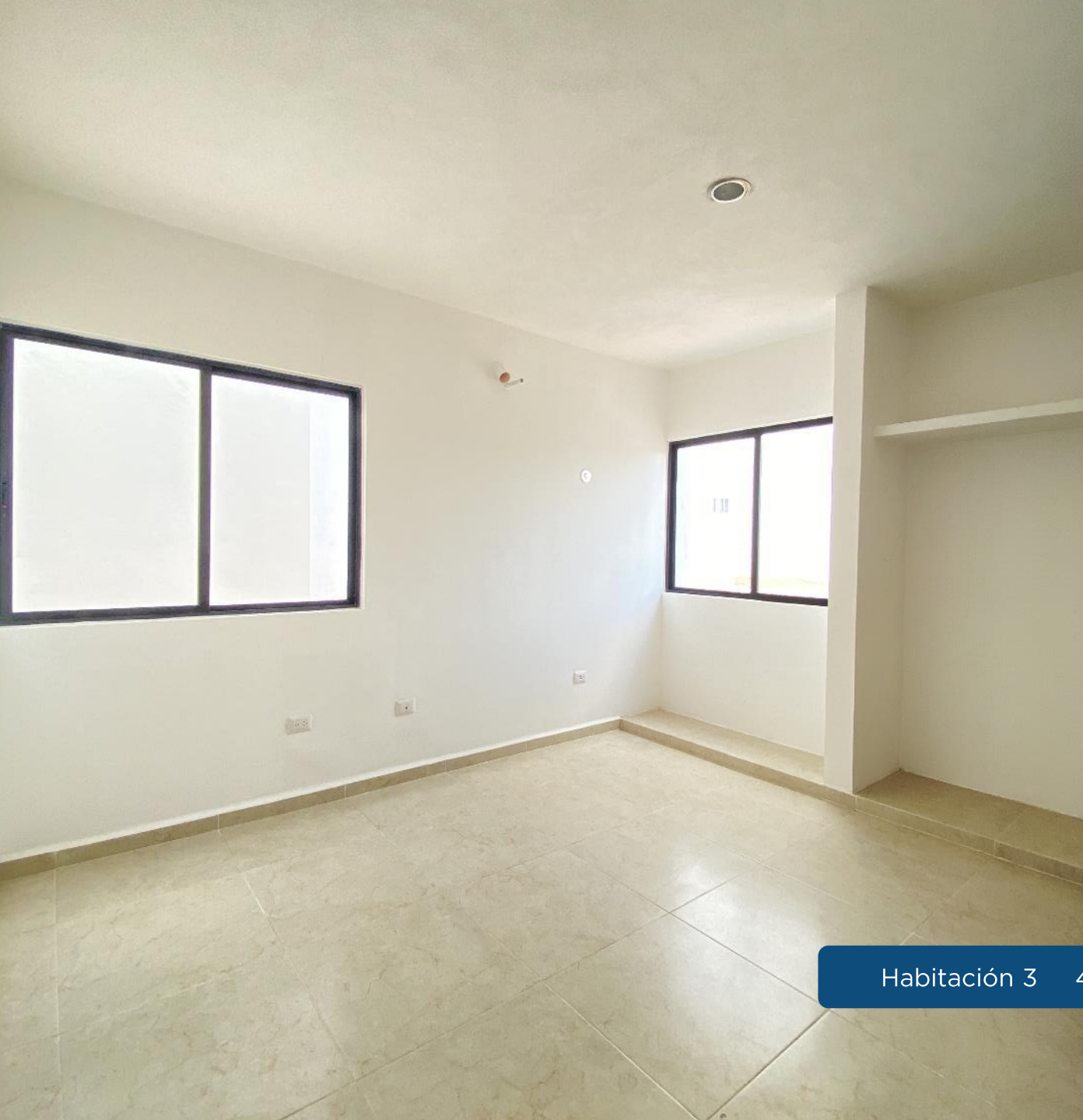
Habitación 3 4.10 m x 3.50 m