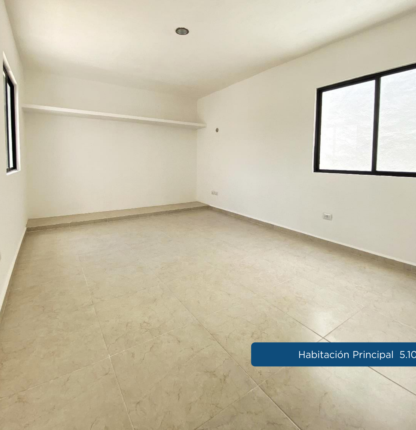
Habitación Principal 5.10 m x 3.50 m