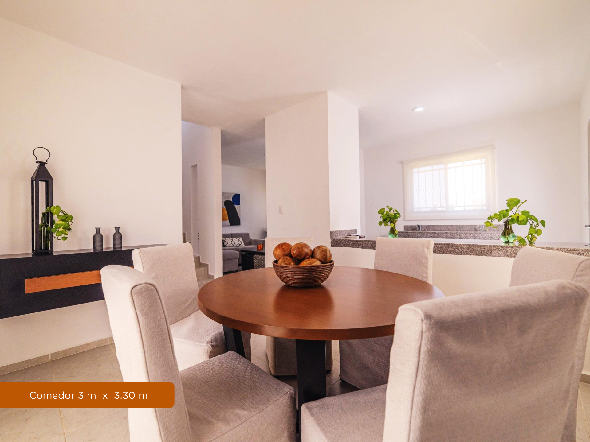
Comedor 3 m x 3.30 m